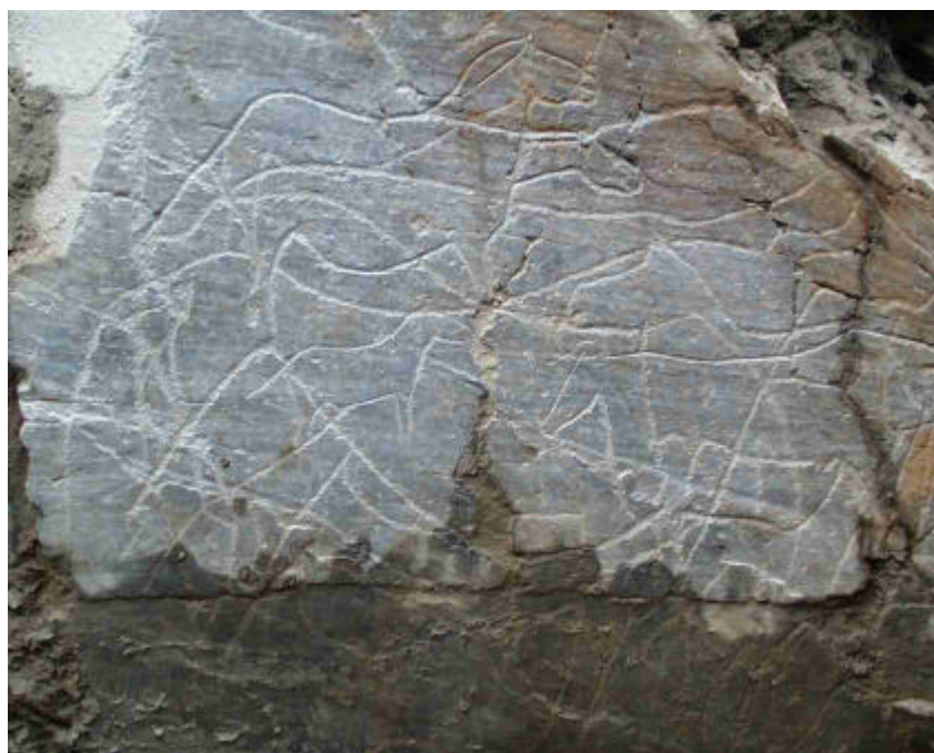
Fariseu. Sector direito do painel enterrado.