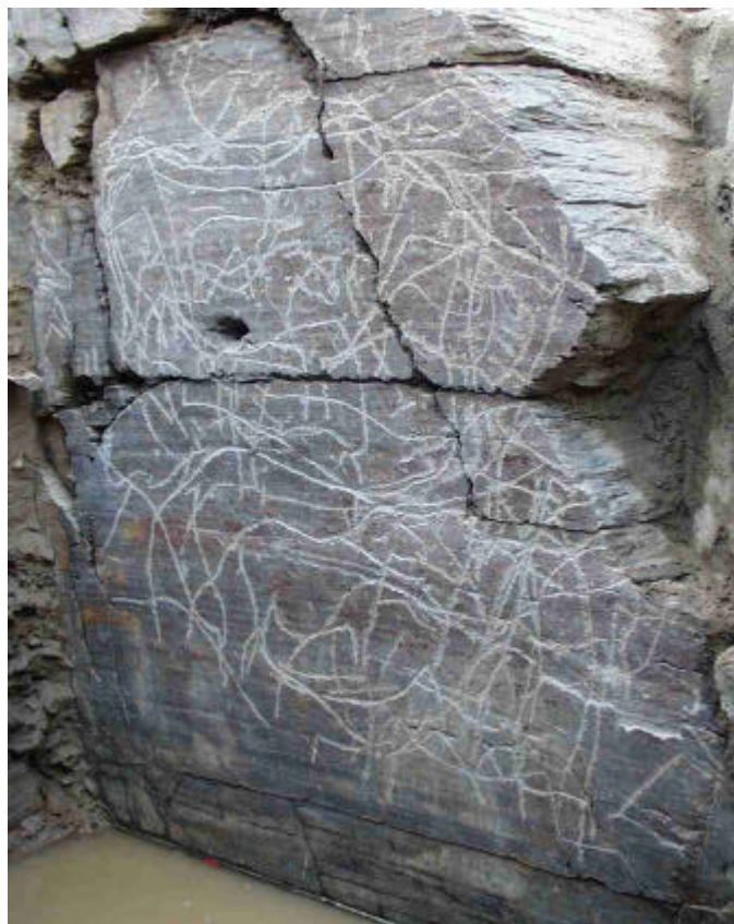
Fariseu. Sector esquerdo do painel enterrado.