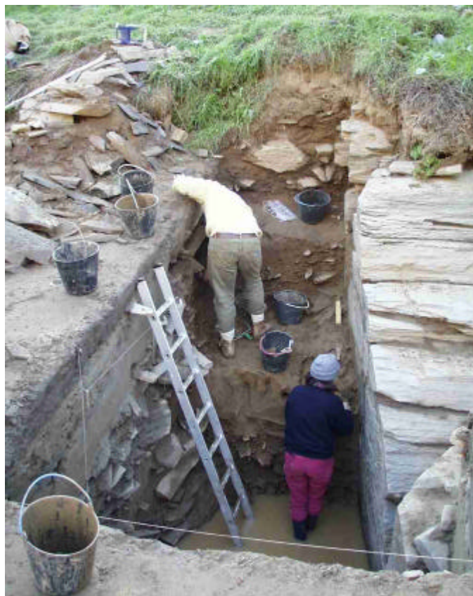
Fariseu. A sondagem arqueológica. À direita, o painel gravado.

O topo da sequência quaternária corresponde a um nível do Magdalenense final "de fácies Carneira", com pontas de dorso curvo espesso, cruzado. Esta fácies industrial está datada de cerca de 10.000 BP noutras jazidas do litoral português (Carneira, Bocas), tanto pelo método do radiocarbono como pelo método da termoluminescência (TL). Era também já conhecida no vale do Côa em cronologia equivalente, confirmada por datações TL obtidas no sítio de Quinta da Barca Sul. No Fariseu, o nível desta época forneceu ainda o primeiro objecto de arte móvel do Côa, um seixo de xisto gravado nas duas faces com motivos animais estilizados, geometrizes, com paralelos no Azilense de França.